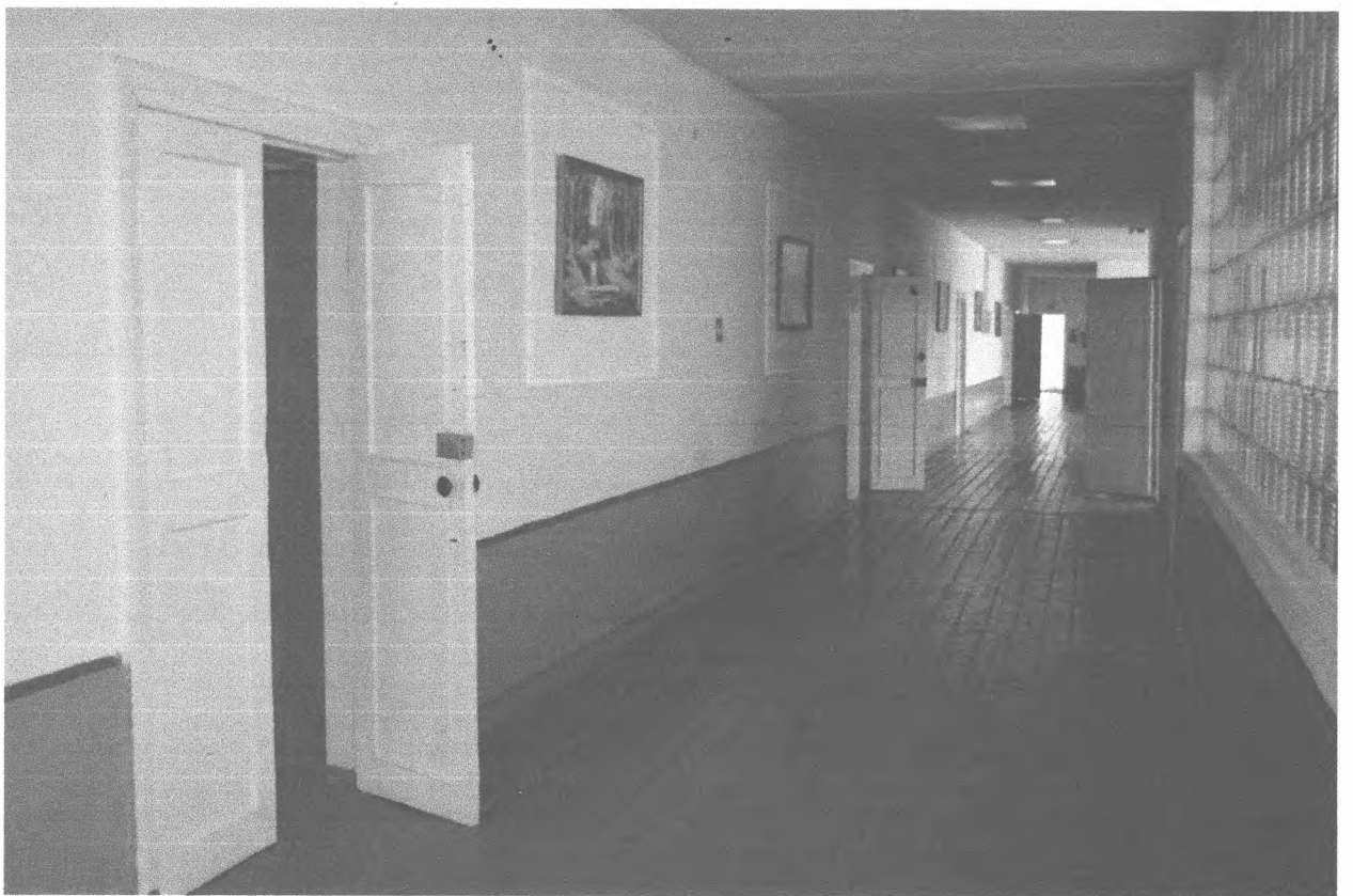
9. Кабинетная форма обслуживания