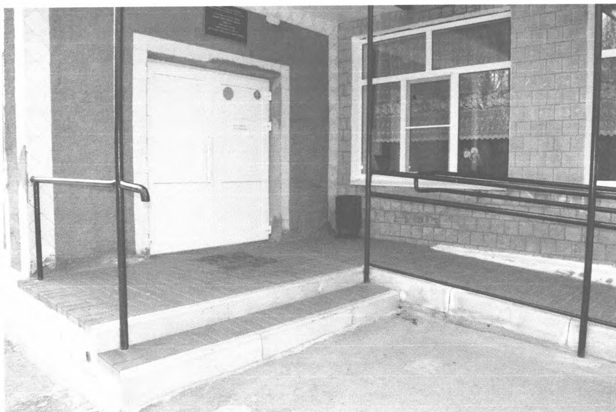
2. Входная площадка