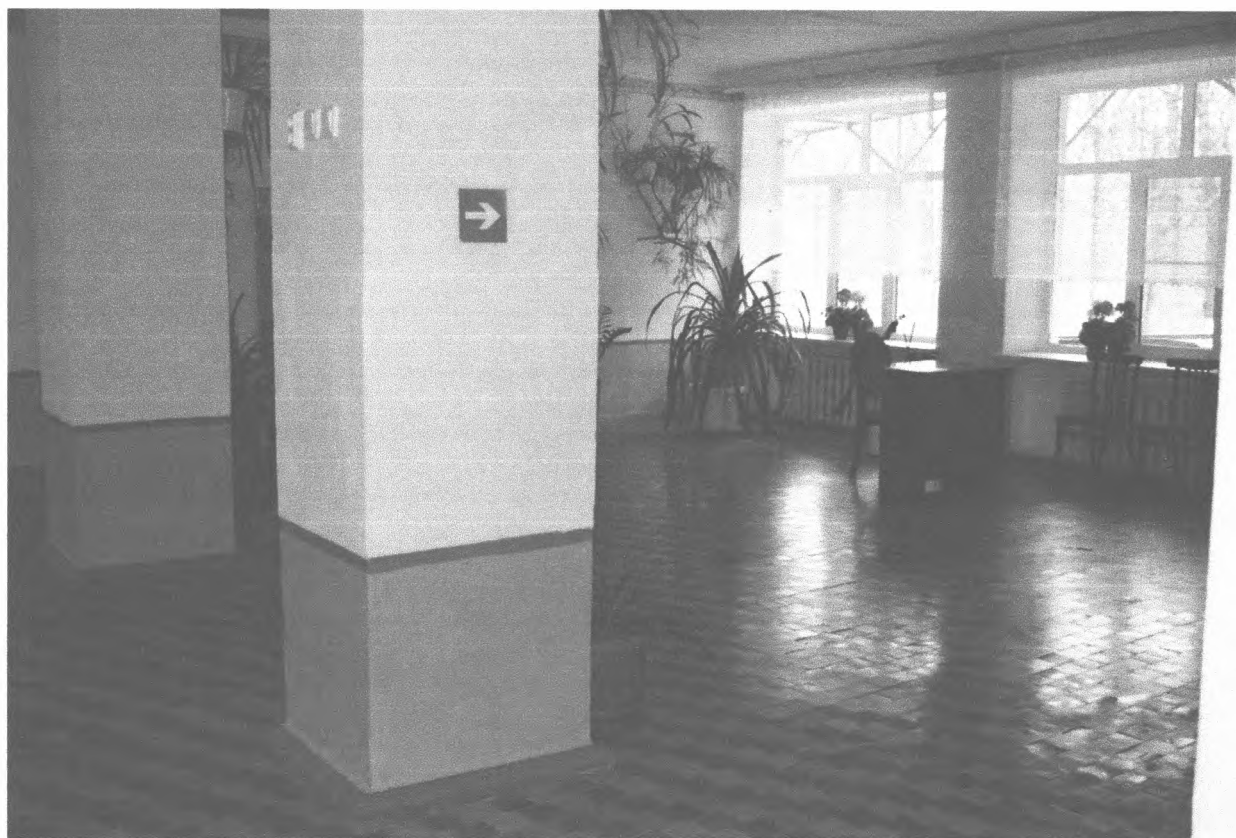
5. Зона ожидания