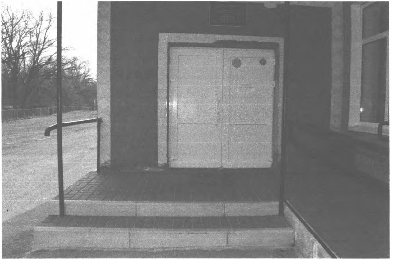
3. Входная дверь