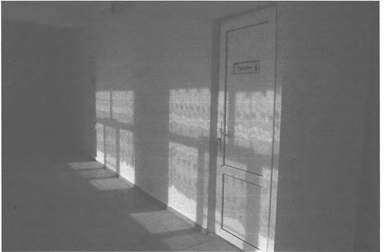
10. Туалетные комнаты